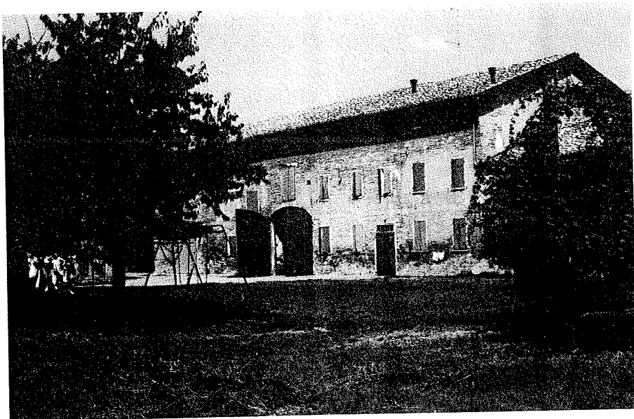
Via Spagnoli. Edificio rurale, 239.

Infine alla curva della strada verso "Il Casino" si osserva un edificio rurale a corpi giustapposti in linea, orientato in direzione est-ovest, con porta morta a sesto ribassato e copertura a quattro falde a colmo costante. Il civile, su due piani e sottotetto, ha luci regolari e simmetricamente distribuite.