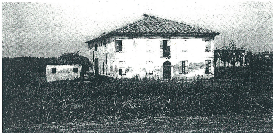
Via per Modena. Edificio rurale, 227.