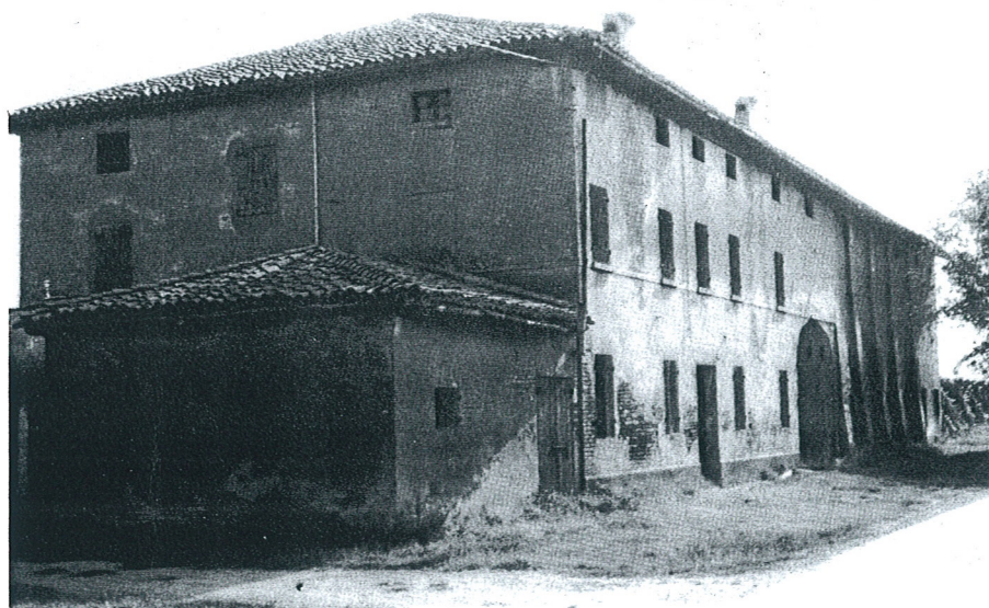
Possessione Canale. Edificio rurale, 171.

La cartografia dell'I.G.M. del 1884 riporta la denominazione "C. Sella". Notabile il vecchio caseificio a pianta rettangolare, isolato, con copertura a due falde. I prospetti sono distinti da grandi luci a traforo in laterizio ripartite in cinque filari.