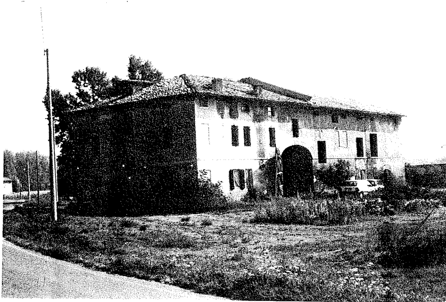
Via Sinistra Tresinaro. Edificio rurale, 237.